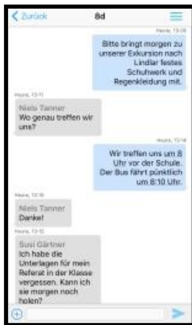
Der Nachrichtenverlauf aus einer Klasse